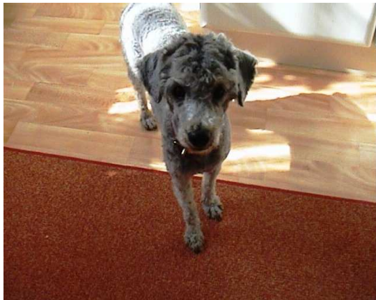
der Filz ist ab, aber Lilu muss sich erst einmal an Den neuen Haarschnitt gewöhnen :-)))