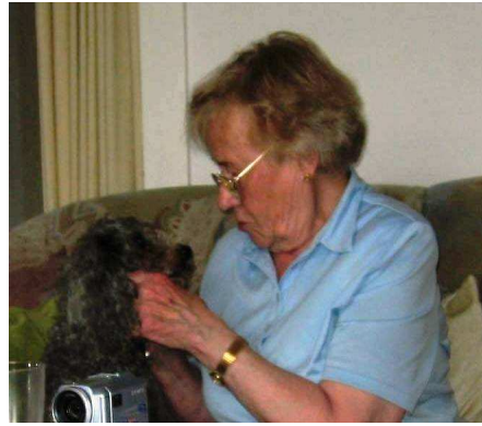
Erster Tag und erste Kontaktaufnahme, sieht doch gut aus oder??