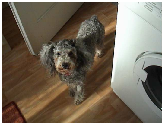
Lilu war völlig verfilzt und wartet auf den Friseur