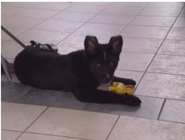
Mein Lieblingsspielzeug macht richtig schön viel krach ...