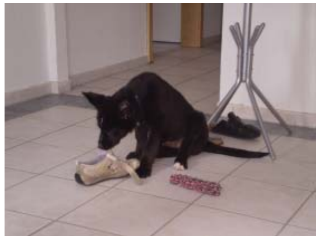
So ungenügend das vierte Paar Schuhe hatte ich schon ...