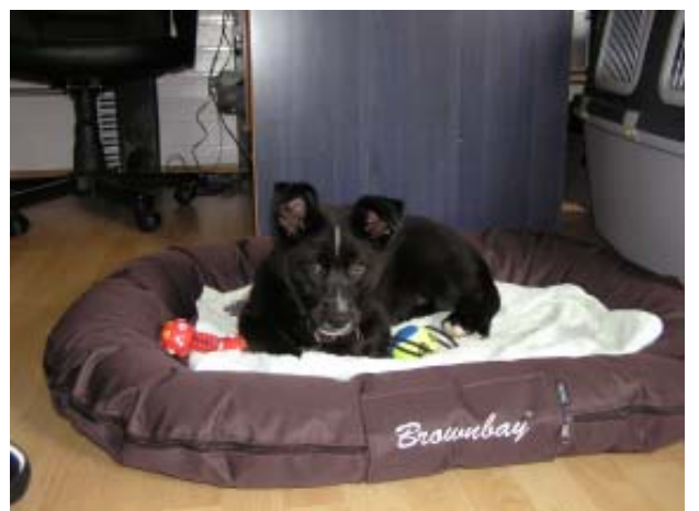
Schüß Ihr Lieben bis die Tage ich mache jetzt erst mal ein Schläfchen ...