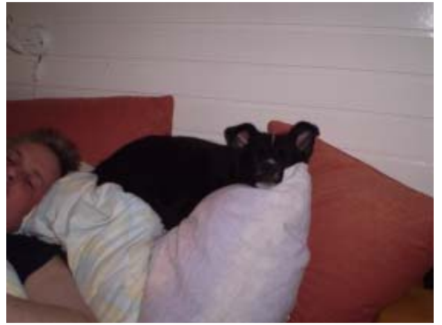
Einmal habe ich es schon ins Bett geschafft ...