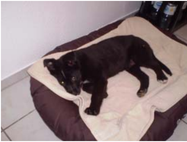
Mein Nachtlager sehr bequem